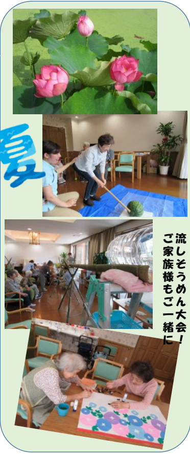
流し ご家族様もご一緒に！