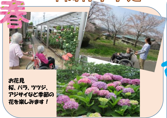
お花見 桜、バラ、ツツジ、 アジサイなど季節の 花を楽しみます！