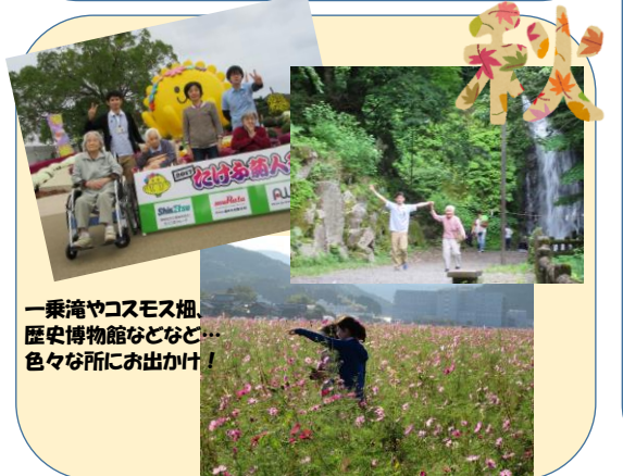
一乗滝やコスモス畑、 歴史博物館などなど… 色々な所にお出かけ！